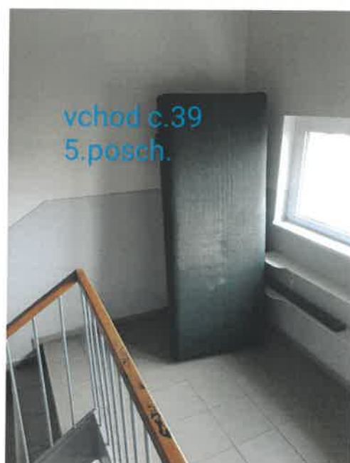
vchod c.39 5.posch.