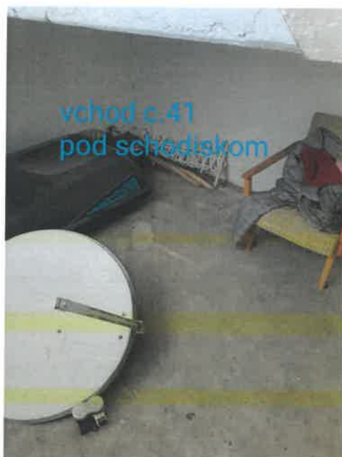
vchod c.41 pod schodiskom