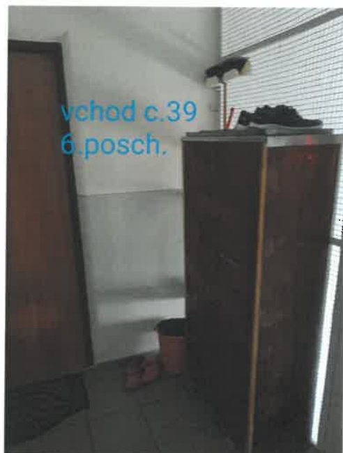
vchod c.39 6.posch.