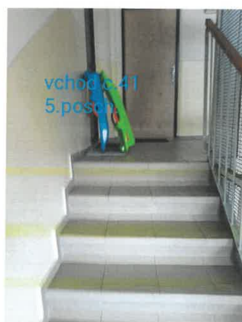
vchod c.41 5.posch.