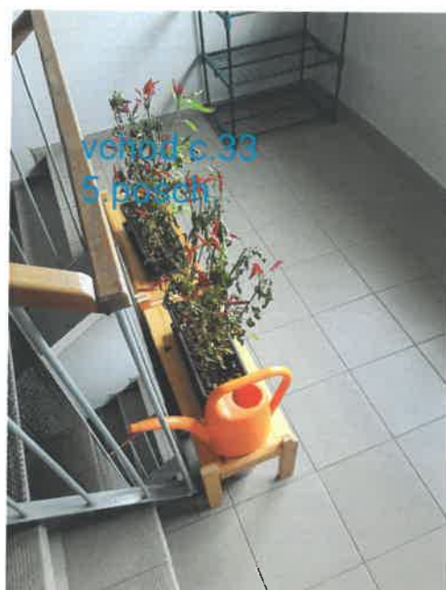
vchod c.33 5.posch.