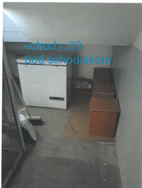
vchod c.33 pod schodiskom