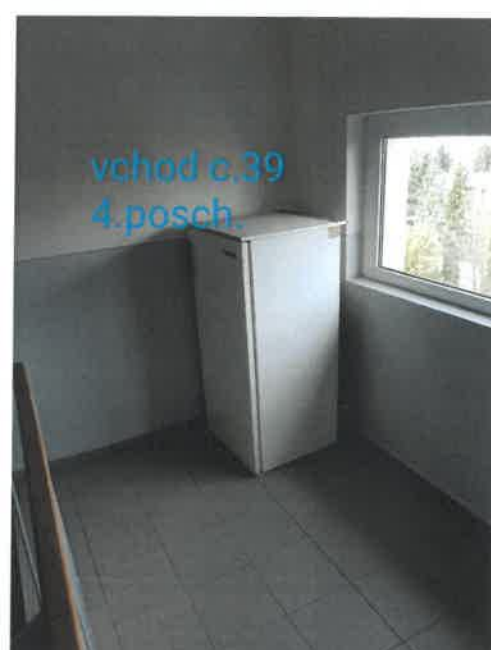
vchod c.39 4.posch.