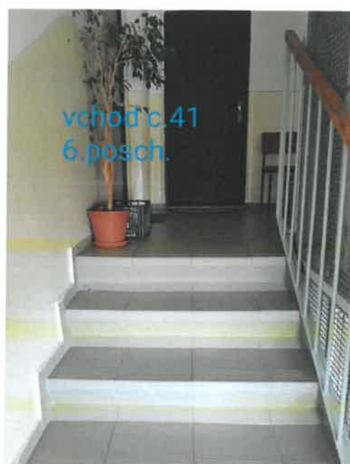
vchod c.41 6.posch.